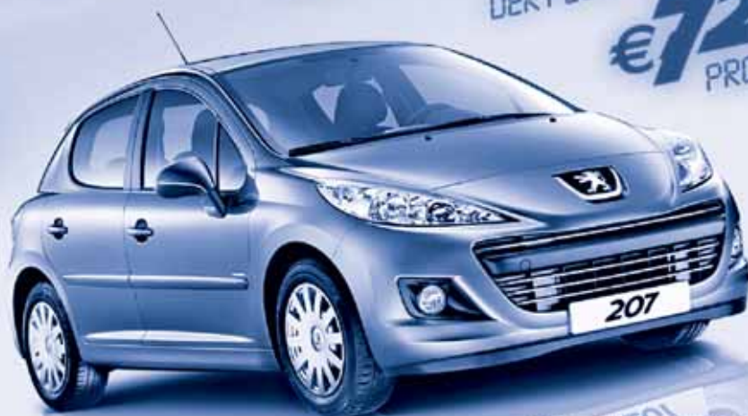
Abb. enthält Sonderausstattung.